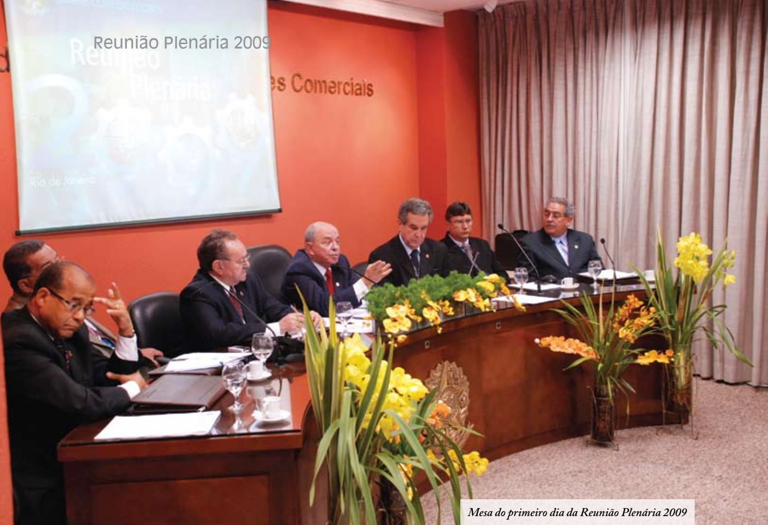
Mesa do primeiro dia da Reunião Plenária 2009