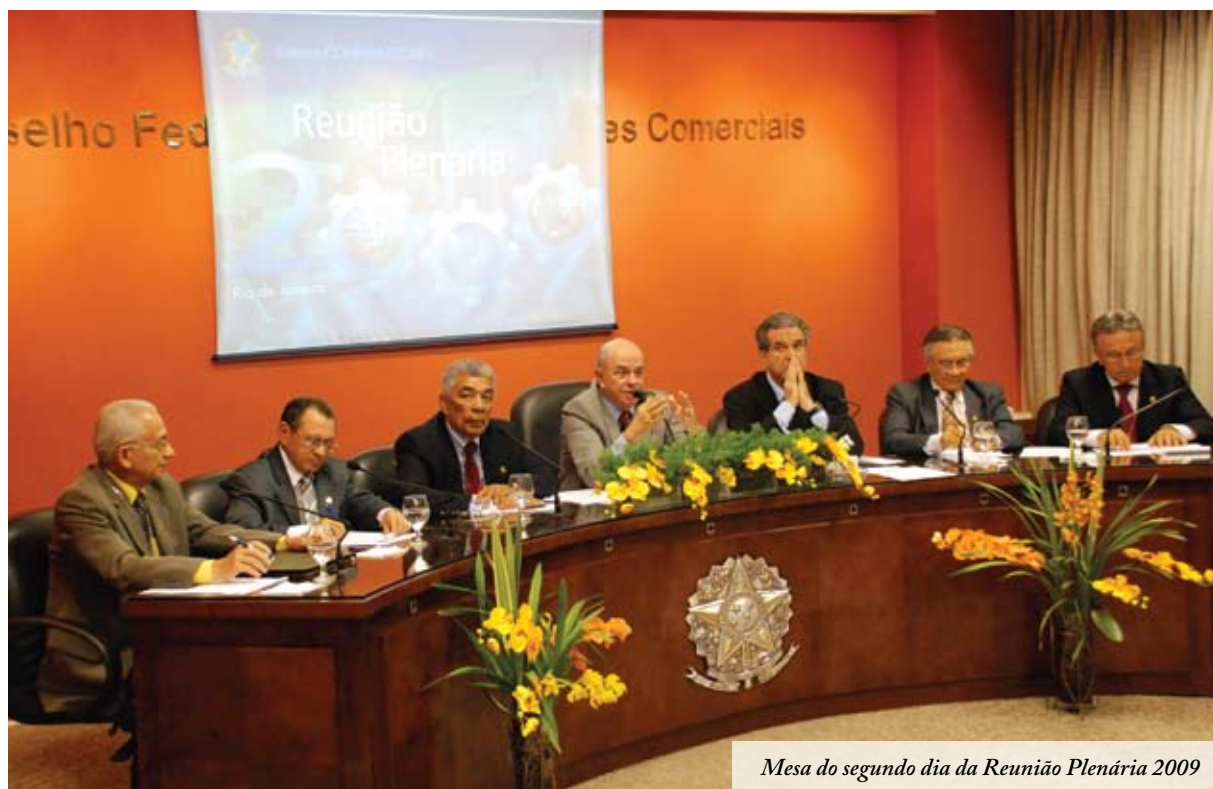
Mesa do segundo dia da Reunião Plenária 2009