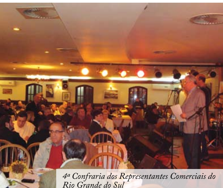
4ª Confraria dos Representantes Comerciais do Rio Grande do Sul

O próximo encontro da Confraria dos Representantes Comerciais está previsto para o dia 4 de outubro, em comemoração ao Dia Pan-americano do Representante Comercial.