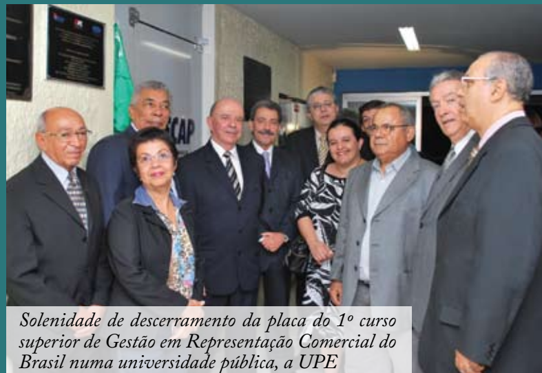
Solenidade de descerramento da placa do 1º curso superior de Gestão em Representação Comercial do Brasil numa universidade pública, a UPE