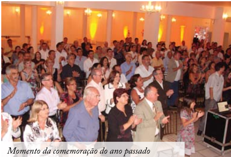
Momento da comemoração do ano passado

O Sinrecoms, em parceria com o Core-MS, promove, pelo sétimo ano, uma ampla programação festiva em homenagem ao Dia Pan-americano do Representante Comercial.