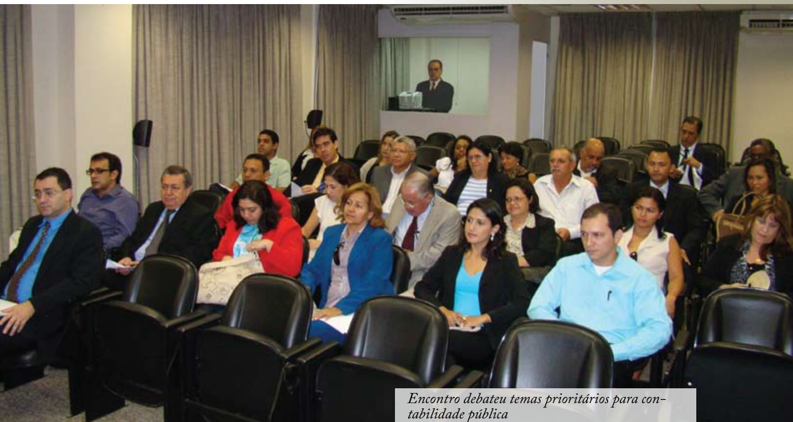
Encontro debateu temas prioritários para contabilidade pública