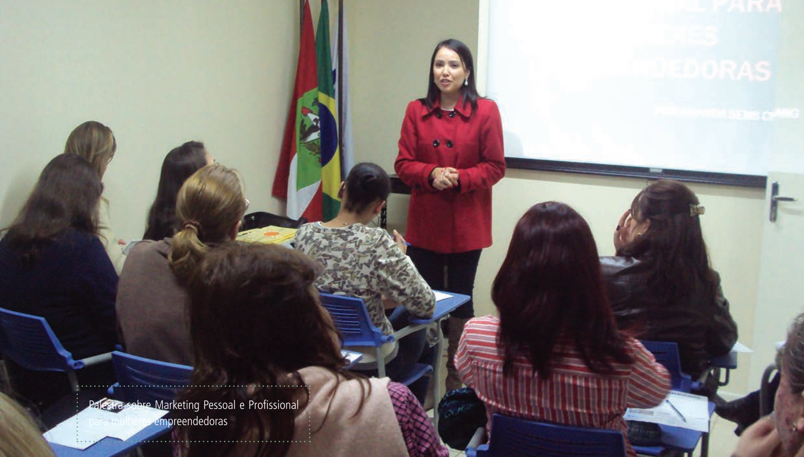
Palestra sobre Marketing Pessoal e Profissional para mulheres empreendedoras