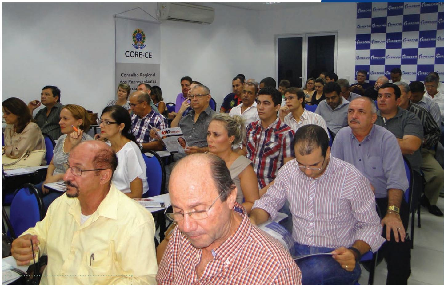
Representantes comerciais atentos à palestra

E ncerrando as comemorações ao Dia Pan-americano do Representante Comercial, o Core-CE realizou, no dia 06 de novembro, em seu auditório, a palestra "Campeões em Vendas".