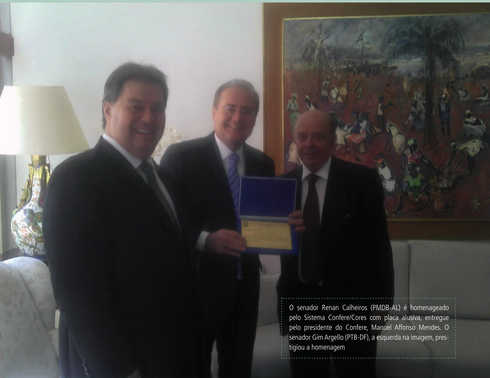
O senador Renan Calheiros (PMDB-AL) é homenageado pelo Sistema Confere/Cores com placa alusiva, entregue pelo presidente do Confere, Manoel Affonso Mendes. O senador Gim Argello (PTB-DF), a esquerda na imagem, prestigiou a homenagem

No dia 05 de dezembro de 2013, o Confere homenageou o presidente do Senado, Renan Calheiros (PMDB-AL). "O senador é um grande amigo da categoria dos representantes comerciais e o Sistema Confere/Cores o agraciou, por reconhecimento e gratidão pela luta da manutenção dos direitos da nossa classe", destacou Manoel Affonso Mendes, presidente do Confere.