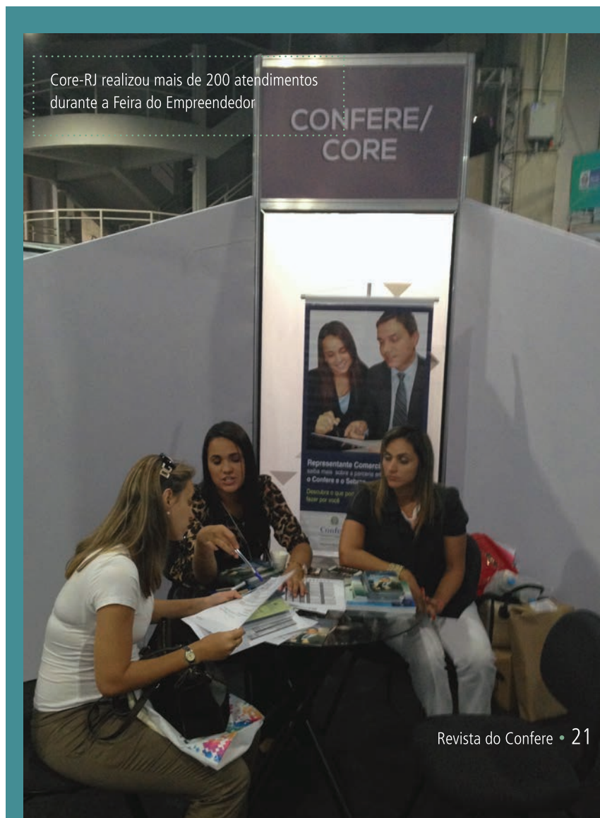
Core-RJ realizou mais de 200 atendimentos durante a Feira do Empreendedor

que empresários pudessem resolver questões com fornecedores, clientes, funcionários e sócios e tirar dúvidas sobre a melhor forma de solucionar problemas sem ter que recorrer à Justiça.