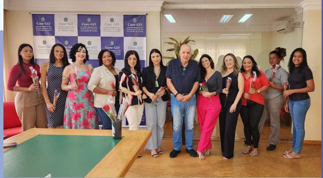
Legenda: Funcionárias do Core-GO recebem homenagem no dia 08 de Março.

Na manhã do Dia Internacional da Mulher (08/03), o Core-GO parabenizou as funcionárias com um café da manhã, que ocorreu às 08h30, na sede do Conselho. Além disso, foram distribuídas flores para as 14 colaboradoras que integram a autarquia e o departamento de informática confeccionou lembranças com doces e recados escritos à mão, a fim de celebrar e reconhecer o empenho das colaboradoras.