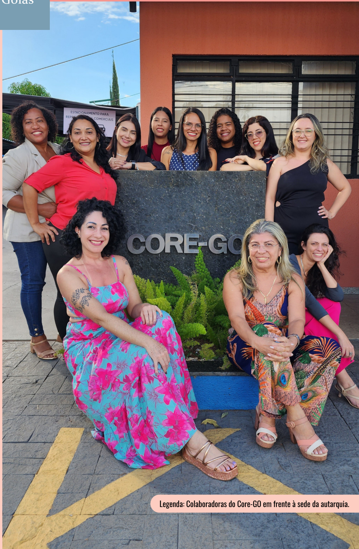
Legenda: Colaboradoras do Core-Go em frente à sede da autarquia.